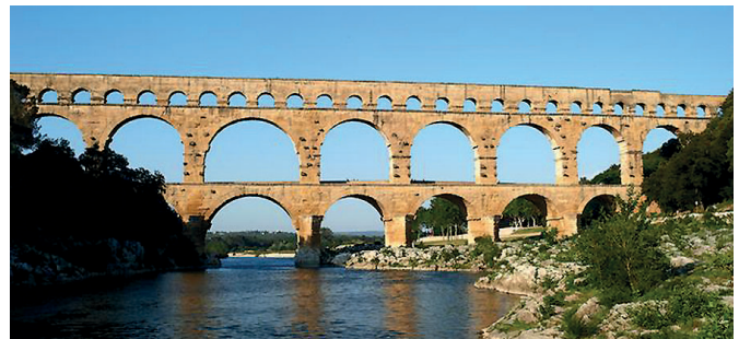
7. ábra. A Pont du Gard

lében egyazon alépitményen haladt az Aqua Marciával és az Aqua Juliával. (A csatornák egymás alatt helyezkedtek el). A Capitolium környékét látta el. Vize langyos és zavaros volt, ezért a városba érve keverték az Aqua Juliával. Az Aqua Virgo északról érte el a várost, és Agrippa fürdőjénél (a Pantheon közelében) végződött. Igen tiszta vize volt, 1453-ban V. Miklós állította helyre. Ma is működik, a Trevi-kutat is táplálja. Az Aqua Alsietana nyugatról haladt a városba, rossz ízű vize nem volt iható. Főként az Augustus-féle naumachia (tengeri csaták rendezésére szolgáló medence) feltöltésére használták. Az igen jó vízű Aqua Claudia a város közelében, az Aqua Anio Novus sal közös alépitményen át vezetett (3–4. ábra). Nero a Coelius, Domitianus a Palatinus dombig hosszabbította meg. V. Sixtus alatt Acqua Felice néven restaurálták. Az Aqua Traiana a Bracciano-tó környéki forrásokból hozta a vizet. V. Pál 1612-ben G. Fontanával felújította és a Janiculus-dombon nagy kútházat építtetett számára F. Ponzióval. Új nevén ez lett az Acqua Paola. Az Aqua Alexandrina Nero fürdőjénél ért véget (5. ábra). Ennek és az Aqua Claudianak boltívei voltak a legmagasabbak, akár 30 m-esek. Az aquaeductusok maradványait a városon belül és azon kívül, számos helyen megtalálhatjuk. Róma délkeleti külvárosában, a Via Lomonía No. 256