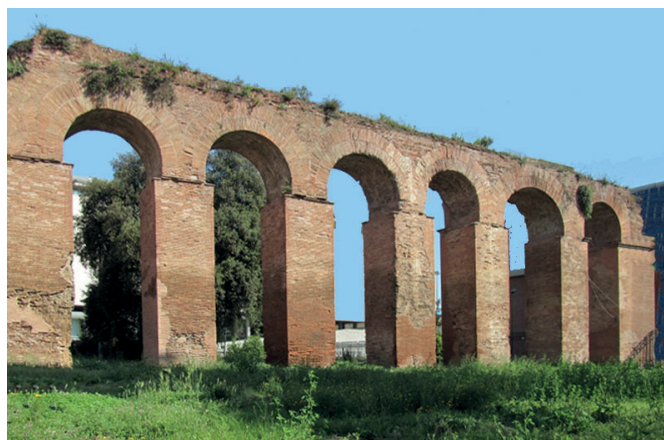
2. ábra. Az Aqua Julia

A 11 antik vízvezeték hossza meghaladta a 400 km-t, és naponta több mint egymillió köbméter vizet szállított a városba (1. táblázat). Az Anio folyóból eredő Aqua Anio Vetus és Aqua Anio Novus vizét zavarosnak tartották. Az Aqua Marcia vezetéke nyúlt a leghosszabbra. Bőséges vize tiszta és hideg volt. Az Aqua Julia az Aventinusra vezetett (2. ábra). Az Aqua Tepula a város köze-