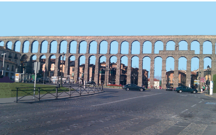
6. ábra. A segoviai aquaeductus

lében egyazon alépitményen haladt az Aqua Marciával és az Aqua Juliával. (A csatornák egymás alatt helyezkedtek el). A Capitolium környékét látta el. Vize langyos és zavaros volt, ezért a városba érve keverték az Aqua Juliával. Az Aqua Virgo északról érte el a várost, és Agrippa fürdőjénél (a Pantheon közelében) végződött. Igen tiszta vize volt, 1453-ban V. Miklós állította helyre. Ma is működik, a Trevi-kutat is táplálja. Az Aqua Alsietana nyugatról haladt a városba, rossz ízű vize nem volt iható. Főként az Augustus-féle naumachia (tengeri csaták rendezésére szolgáló medence) feltöltésére használták. Az igen jó vízű Aqua Claudia a város közelében, az Aqua Anio Novus sal közös alépitményen át vezetett (3–4. ábra). Nero a Coelius, Domitianus a Palatinus dombig hosszabbította meg. V. Sixtus alatt Acqua Felice néven restaurálták. Az Aqua Traiana a Bracciano-tó környéki forrásokból hozta a vizet. V. Pál 1612-ben G. Fontanával felújította és a Janiculus-dombon nagy kútházat építtetett számára F. Ponzióval. Új nevén ez lett az Acqua Paola. Az Aqua Alexandrina Nero fürdőjénél ért véget (5. ábra). Ennek és az Aqua Claudianak boltívei voltak a legmagasabbak, akár 30 m-esek. Az aquaeductusok maradványait a városon belül és azon kívül, számos helyen megtalálhatjuk. Róma délkeleti külvárosában, a Via Lomonía No. 256