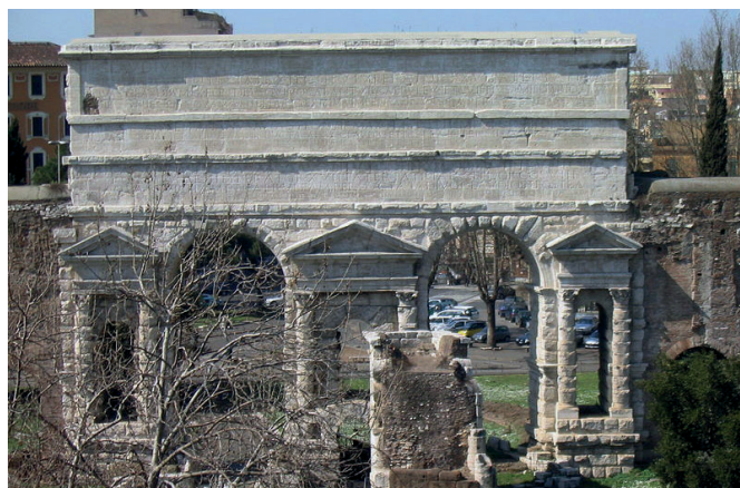
4. ábra. Kettős csatorna a Porta Maggiore felett