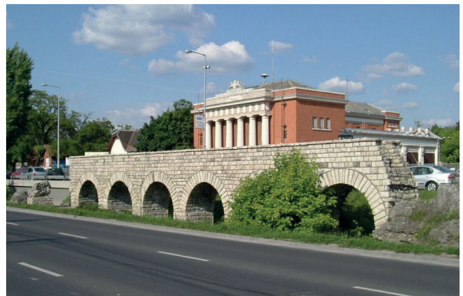
8. ábra. Aquincumi aquaeductus-részlet

alatti parkban (Parco dei Acquedotti) hat vezeték maradványai tekinthetők meg.