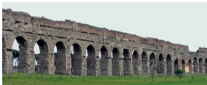
3. ábra. Az Aqua Claudia Róma közelében