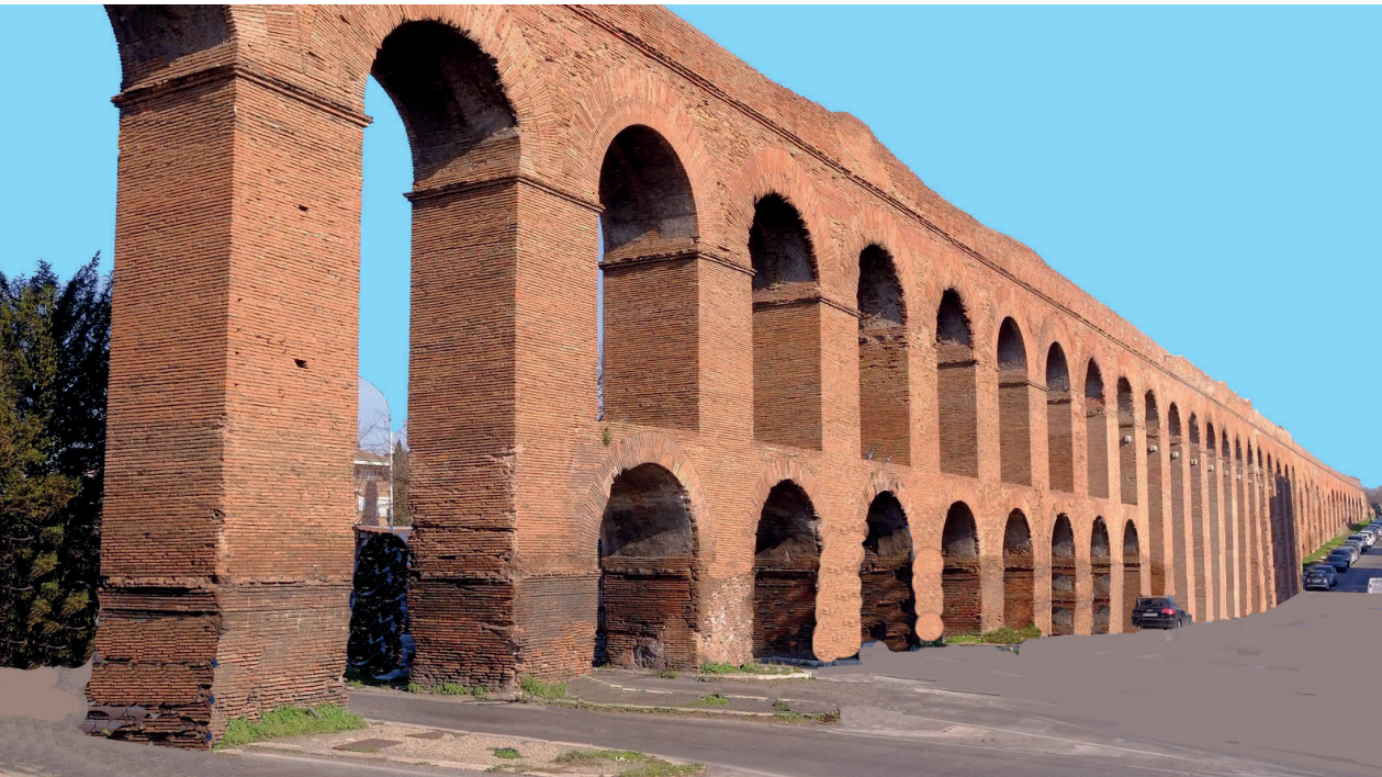
5. ábra. Az Aqua Alexandrina