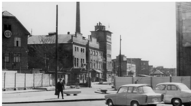
A KÉPEK AZ EGIS GYÓGYSZERGYÁR ZRT. GYŰJTEMÉNYÉBŐL SZÁRMAZNAK

Örkényt nem fogták perbe, és nem vonták vád alá – „csak” megélhetésétől fosztották meg. Szorult helyzetében kapóra jöttek sosem használt diplomái. Ő maga így emlékezett erre vissza. „S ekkor egyszer csak elfogyott körülöttem a levegő. Ez 57-ben kezdődött, odáig még vígan közöltek engem, hiszen nem is voltam hivatalosan letiltva; nem is tudom, hogy ilyen letiltás egyáltalán létezett-e. Hanem, gondolom, minden szerkesztőt, aki engem közölt, jól letolták ezért. Ennek hamar híre ment, és így találtam magam feketelistán. Aztán megjött a Szépirodalmi Kiadótól a felmondólevél – persze, a minisztérium utasította őket erre –, és kérték, hogy ne járjak be ezután a kiadóba. Amikor fordítást próbáltam kérni, szerkesztést, kontrollszerkesztést, azt sem kaptam; szóval, semmi jövedelem nem volt. Ekkor írtam Aczél Györgynek egy levelet [...] hogy irodalmi munkásságomból megélni nem tudok, mert nem jelenhetek meg; kértem, hogy megpróbálok gyárban elhelyezkedni, de semmi kilátásom sincs, hogy egy gyárba fölvegyenek azzal a priusszal, hogy én 56-ban isten tudja, mi- ket vittem végbe – adjon egy levelet, amelyet annak a gyárnak a személyzeti osztályán, ahol felvételt kérek, bemutathatok. Erre ő