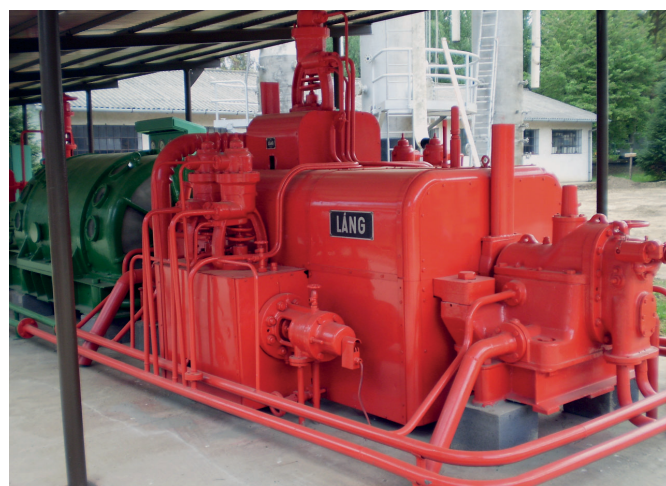
Gőzturbina az 1930-as évekből