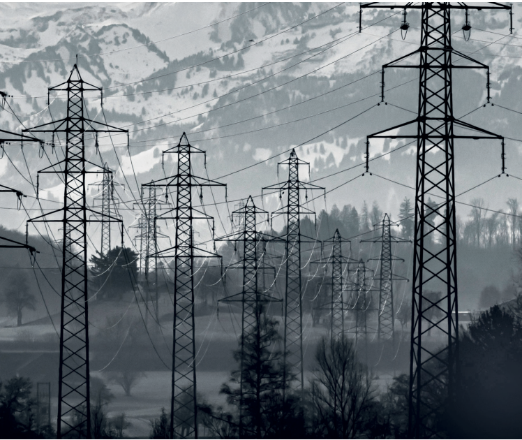
Svájci „látkép”