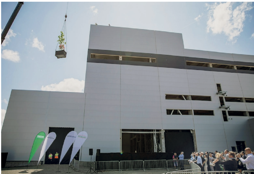
1. ábra. A szerencsi üzemépület bokrétaünnepsége

A 47,5 millió eurós beruházással a 11 500 m 2 alapterületű üzemben évi 19 ezer tonna üveggyapot hőszigetelőanyag gyártására kerül sor. A vállalat irányításához kapcsolódó menedzsmentjogok gyakorlását a Masterplast látja el, a cég teljesítményét a konszolidált eredményeibe számítják be.