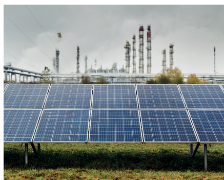
A MOL Petrolkémia már meglévő, 6 MW-os naplemparkjának részlete

A projekt több szempontból is támogatja a fenntarthatóságot: